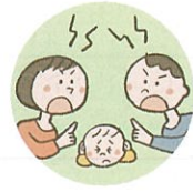
配偶者への暴力や暴言をこどもに見せること