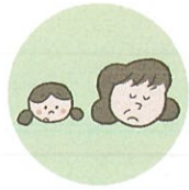
こどもを無視したり、拒否的な態度を示すこと