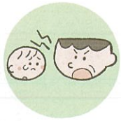
言葉で脅したり、脅迫すること

体罰は暴力でこどもの身体を傷つけるもので、心理的虐待は暴言などでこどもの心に深い傷を負わせるものです。こども本人への暴言でなくとも、配偶者や家族に対する強い言葉などもこどもの心を傷つけ、発達に影響する可能性があります。