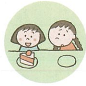
他のきょうだいとは著しく差別的な扱いをすること