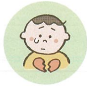
こどもの心や自尊心を傷つけるような言動をしたり、繰り返し言うこと