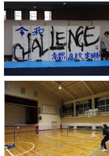
▲授業風景と学校行事

中学校を卒業したばかりの方から20歳を越えた方まで幅広い年齢層の生徒が在籍しており、多くの生徒が勉学と仕事を両立させ日々努力を重ねています。通常は4年間で卒業することになりますが、高等学校卒業程度認定試験や定通併修による通信制高校での履修により、一定の単位を修得すれば3年で卒業できます。